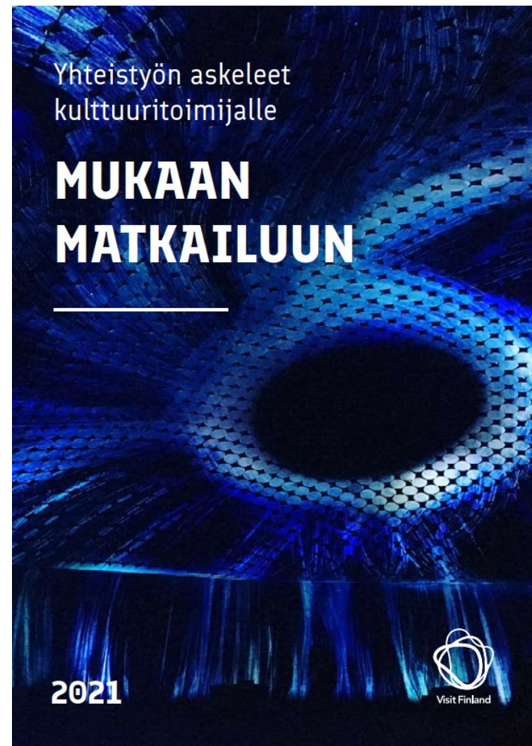
Mukaan matkailuun -opas

Visitfinland.fi → Matkailun julkaisut → Kulttuurimatkailu