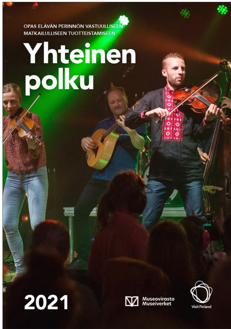
Yhteinen polku -opas